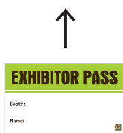
※イベント毎に色やデザインが異なります